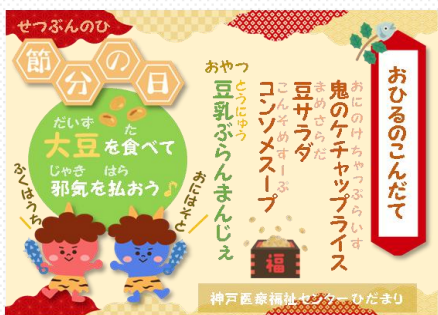
豆乳フランマンジェ